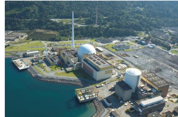
Centrais nucleares Angra 1 e 2.

O nível 3 reflete uma expansão moderada do parque nuclear brasileiro, em linha com os cenários de referência propostos pelo INB (2013) e IEA (2013). Assim, para além das usinas Angra 2 e 3 (nível 1), prevê-se a instalação de quatro novos reatores (capacidade unitária de 1.000 MW), perfazendo um total de 6.785 MW instalados no país em 2050.