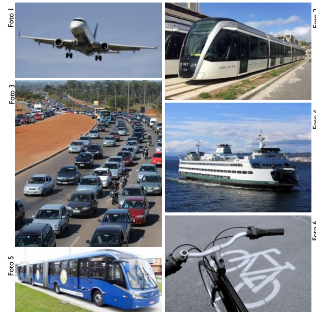
Foto 1: Pixabay | CC0 1.0; Foto 2: VLT. Foto de Mariordo | CC BY-SA 4.0; Foto 3: Adaptado de Fabio Rodrigues Pozzebom/ABr | CC BY 3.0 BR; Foto 4: Pixabay | CC0 1.0; Foto 5: BRT. Foto de Luiznp | CC BY-SA 3.0; Foto 6: Pixabay | CC0 1.0.

O nível 3 assume a manutenção dos modais aeroviário, ferroviário e aquaviário nos mesmos patamares do nível 2, e considera mudanças em infraestrutura de mobilidade urbana que priorizem o transporte não motorizado, em detrimento do transporte rodoviário individual.